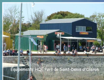
Equipements HQE Port de Saint-Denis d'Oléron

intégration paysagère, chantier 'propre', utilisation de biomatériaux et d'énergies renouvelables, récupération de l'eau de pluie,