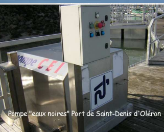
Pompe "eaux noires" Port de Saint-Denis d'Oléron

- en adoptant la démarche Haute Qualité Environnementale (HQE) pour l'ensemble du projet :